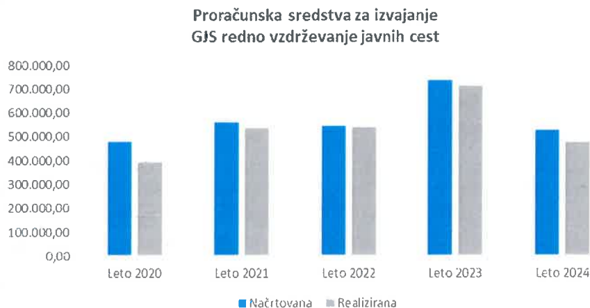
Grafikon 2: Gibanje načrtovanih in realiziranih proračunskih sredstev