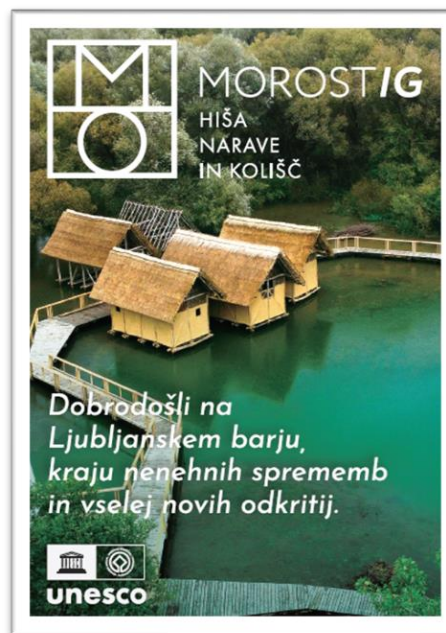
1 Naslovnica zloženke za obiskovalce

V času rednega odprtja je na vsaki lokaciji prisoten po en informator oziroma informator-vodnik (kolišče).