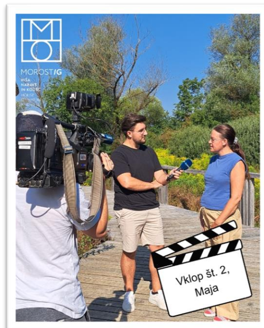
5 Vklp v televizijsko oddajo Jutro

Prispevek »Velikansko praznovanje – 150. obletnica odkritja kolišč v Sloveniji« v publikaciji Palafittes news 2025, ki jo izdaja Mednarodna koordinacijska skupina UNESCO Palafittes, je dodatno utrdil mednarodno prepoznavnost Morostiga.