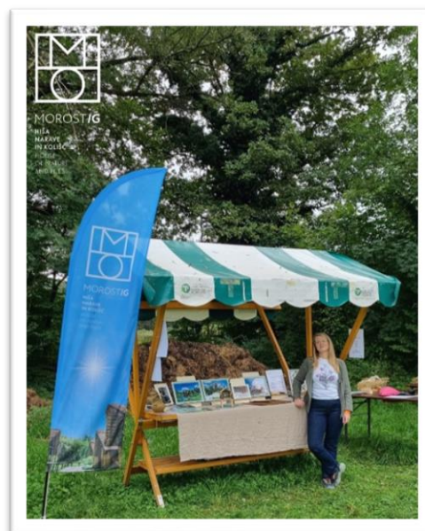
4 Predstavitev Morostiga na Koliščarskem dnevu