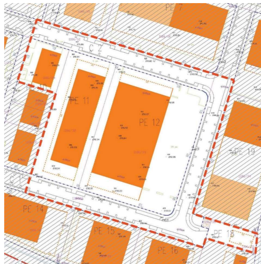
Grafični prikaz: Obstoječa zazidalna situacija - delno območje

Prostori in mesta, kjer se bodo med gradnjo, obratovanjem in opustitvijo pretakale, skladiščile, uporabljale nevarne snovi, njihova embalaža in ostanki, vključno z začasnim skladiščenjem nevarnih odpadkov (npr. motorna goriva, olja in maziva, pesticidi) morajo biti urejeni kot zadrževalni sistem.