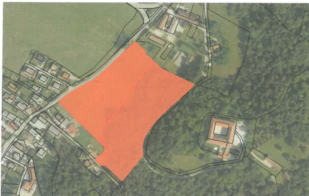
Slika 1: Prikaz zemljišč za gradnjo

Predvidena je izgradnja objekta v velikosti 5.000 m 2 . Izgradnja objekta vključuje tudi komunalno-prometno ureditev ter ureditev okolice v skladu z urbanistično določenimi prostorskimi pogoji in omejitvami, kot je določeno z veljavnim Odlokom o prostorskem redu občine Ig (v nadaljevanju PRO Ig).