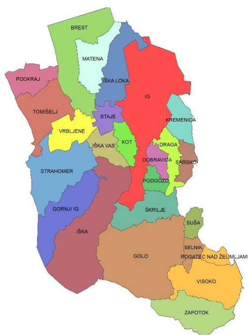
Slika 1: Karta vaški skupnosti v Občini Ig